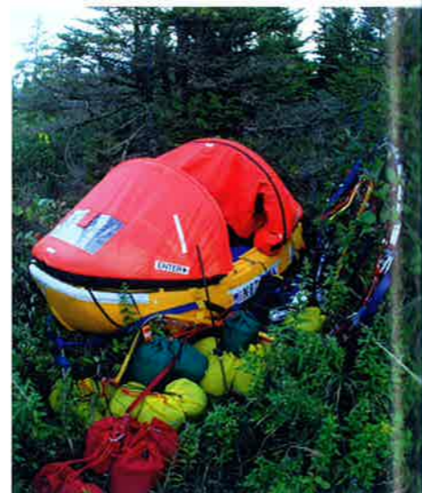
Das »unfreiwillige Camp« im Moor wurde für den Clusterballon-Piloten zur Mückenfalle