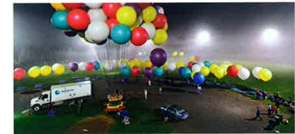
Der Füllvorgang beim Clusterballon ist deutlich aufwändiger als bei einem normalen Gasballon