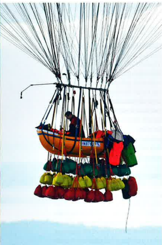
Kurz nach dem Start: Der Ballast hängt

Mit seinem »filmreifen Haus« (BallonSport Magazin 3/11) machte der Clusterballon-Pilot Jonathan Trappe zuletzt von sich reden. Mitte September hat er mit einer neuen, spektakulären Aktion für Aufsehen gesorgt. Er wollte mit einem Bündel von 300 kleinen Ballonen den Atlantik überqueren. Das Vorhaben ging schief. Trotzdem schaffte er eine tolle Leistung