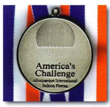
Jonathan Trappes Team belegte 2008 in Albuquerque den 2. Platz

ten uns die anderen Teams, erkennbar durch das Blinken der Nachtfahrbeleuchtung. Das gleichmäßig weiße Licht und die roten Blinklichter können wir nutzen, um unsere eigenen Manöver zu koordinieren.